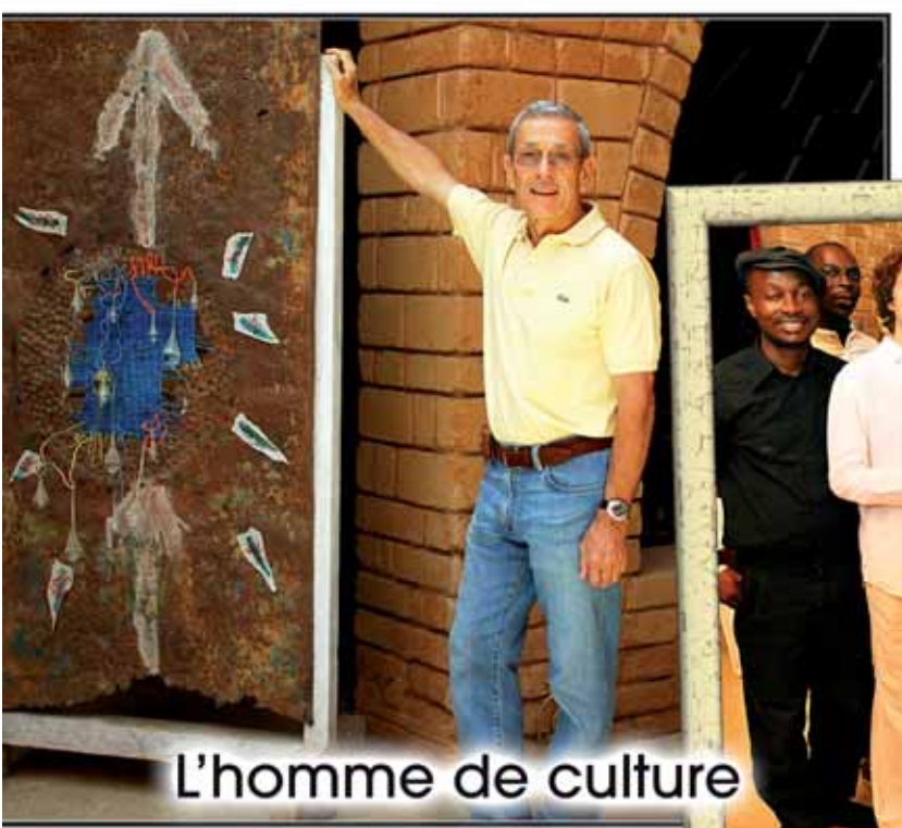
L'homme de culture